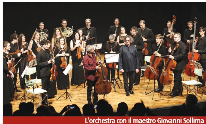
L'orchestra con il maestro Giovanni Sollima

ra, all'interno del suo organico, la presenza di diversi vincitori di Concorsi violinistici nazionali e internazionali; svolge attività di sensibilizzazione alla cultura musicale verso le giovani generazioni, esibendosi in lezioni-concerto in Scuole Primarie e Secondarie di I Grado; vanta la collaborazione con